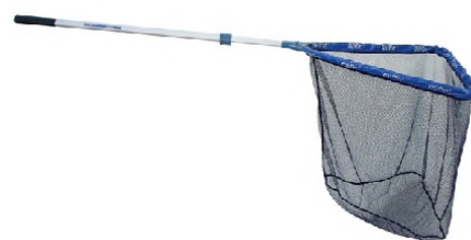
schepnet of landingsnet

Het schepnet of ladingsnet heb je in de hand en de opening net onder water. De vis ziet de opening van het net niet en blijft rustig. Is hij boven de opening van het net gekomen, dan haal je dit een stukje omhoog. Niet te langzaam want dan zwemt de vis op het laatste moment weer weg. Ook niet te wild, want dan zou je de vis nog kunnen beschadigen. Rustig trek je het landingsnet met daarin de vis naar je toe en pas vlak bij de kant til je het net pas echt omhoog.